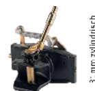
3 mm zylindrisch